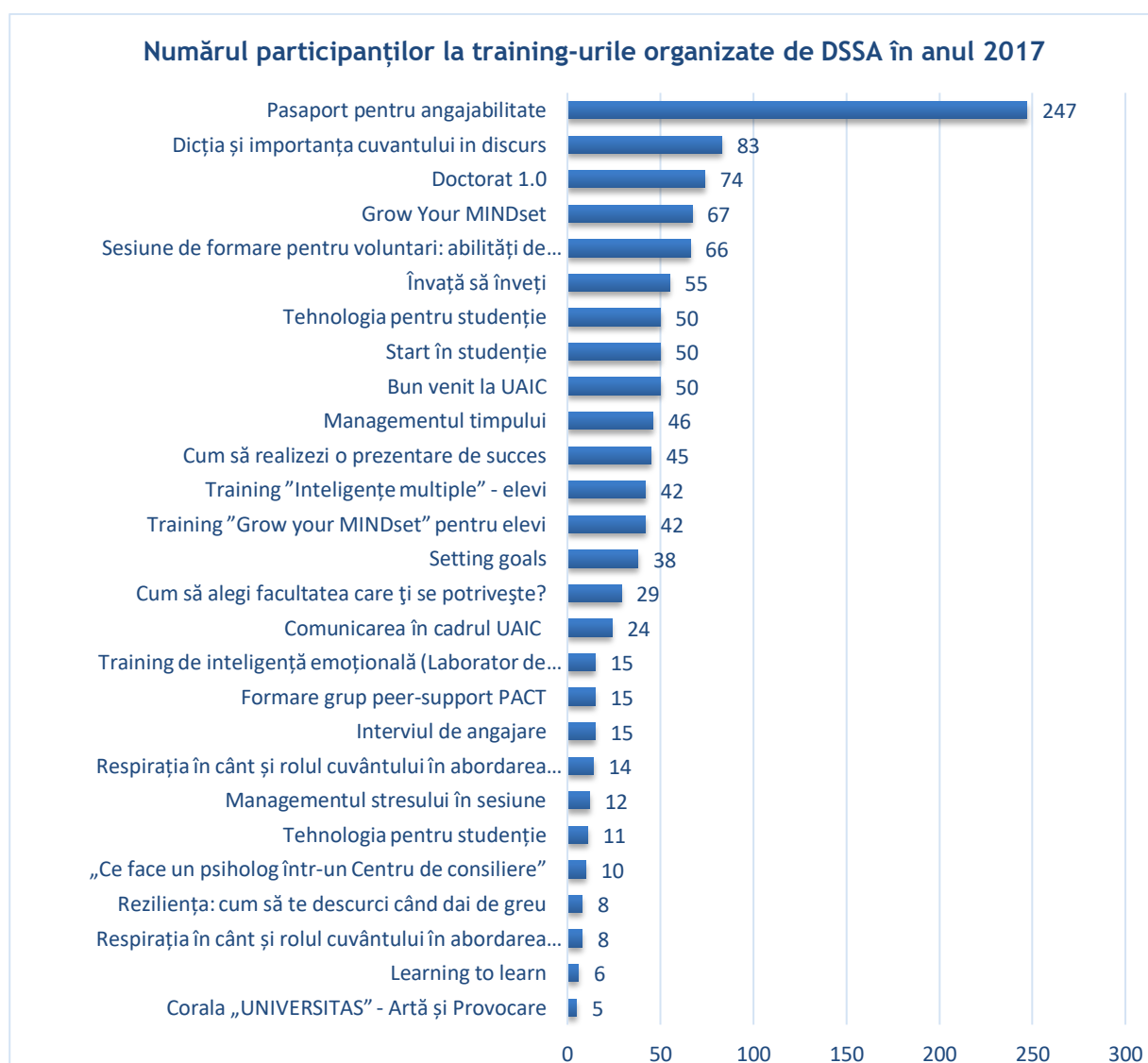
Figură 2. Centralizarea numărului de participanți la training-urile organizate de DSSA în anul 2017 (N=1038 studenți)

Toate training-urile organizate de DSSA sunt proiectate și susținute de întreaga echipă DSSA, în funcție de domeniile de specializare și competențele pe care le deține fiecare dintre membri, activitățile pe care le desfășoară zilnic și proiectele pe care le implementează individual sau în colaborare cu ceilalți colegi din DSSA.