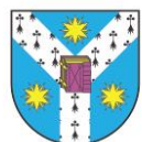
Universitatea „Alexandru Ioan Cuza” Iași